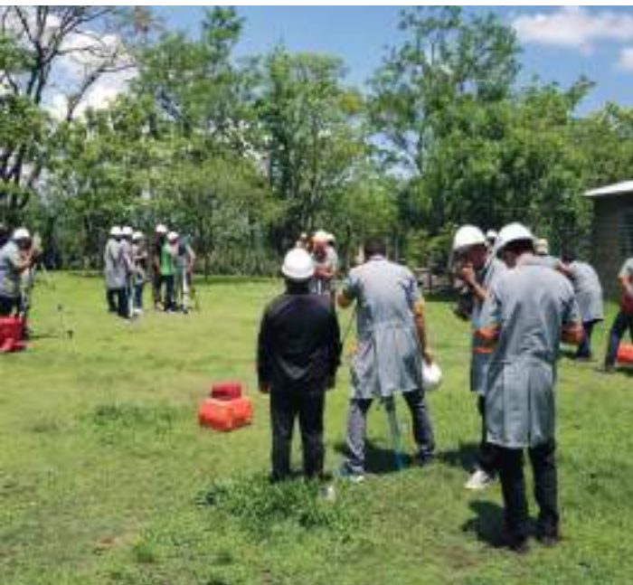
Estudiantes en prácticas de Ingeniería.