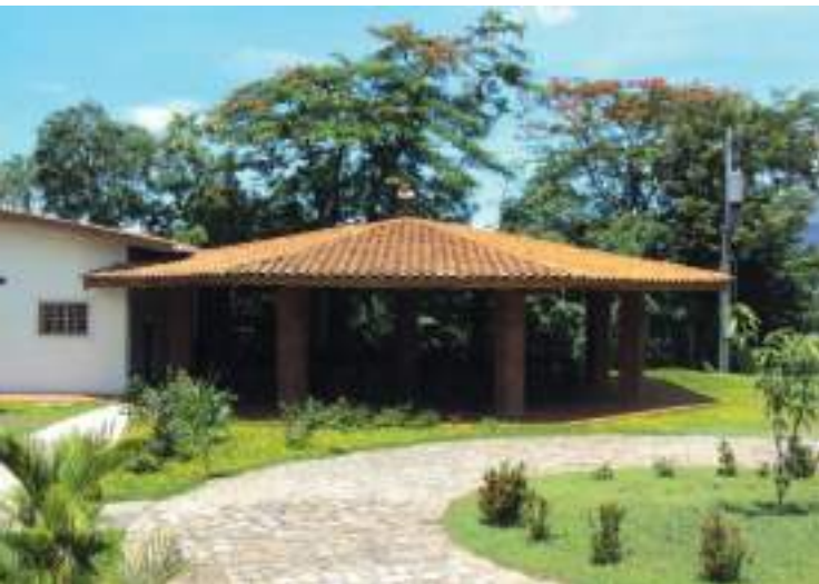
Instalaciones del Restaurante Escuela ITPSM.

En el campus se encuentra el Restaurante-Escuela que dispone de cocina y comedor totalmente equipados para desarrollar las clases y actividades de la carrera Técnico en Hostelería y Turismo.