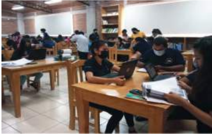
Biblioteca del Instituto Tecnológico Padre Segundo Montes.

una suscripción anual para el Instituto Tecnológico Padre Segundo Montes, para que los estudiantes y docentes puedan tener acceso a la colección cátedra de e-libro, suscrita a través del convenio con el Ministerio de Educación, Ciencia y Tecnología y CBUES. Con este esfuerzo por aportar a la educación de calidad tanto estudiantes como docentes tienen acceso a las plataformas virtuales de e-Libro y Alfa Omega. Dicho acceso es a través de la cuenta brindada por la institución.