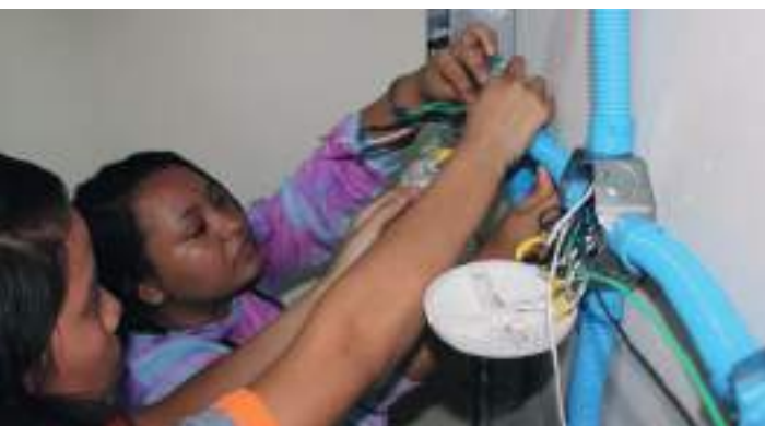
Estudiantes en prácticas de Instalaciones Eléctricas Residenciales.

Laboratorio de electricidad: equipado con herramientas para la práctica de instalaciones eléctricas residenciales e industriales. También se cuenta con equipo para instalaciones fotovoltaicas aisladas y conectadas a la red.