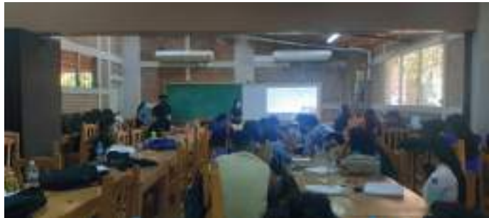
Centro de recursos para el aprendizaje.

Centro de Recursos de Aprendizaje: cuenta con 30 PC de reciente adquisición con Sistema operativo Windows 10 pro versión 1909 y 28 PC con ambiente Linux que facilitan el desarrollo de cursos de informática y de libre office, prácticas de Autocad, entre otros.