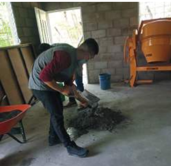
Estudiantes en prácticas de técnicas de construcción.