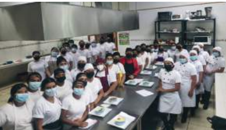
Restaurante Escuela del ITPSM.