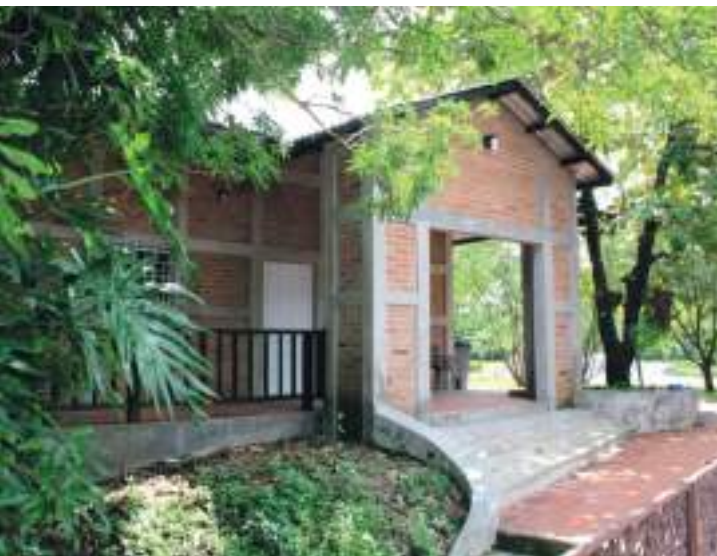
Salón de usos múltiples "Catalina Montes" del Instituto Tecnológico Padre Segundo Montes.

Para garantizar su misión, a partir de 2019, el Instituto cuenta con el apoyo administrativo y académico de la Universidad Centroamericana José Simeón Cañas (UCA) y además está en proceso de convertirse en una sede MEGATEC del Ministerio de Educación, Ciencia y Tecnología.