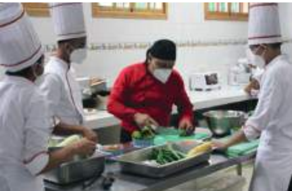
Restaurante Escuela del ITPSM.

Laboratorio de cocina: equipado de cocina industrial y área de preparación de alimentos, mesa fría y caliente, área de lavado, y extractor, almacén y área de atención al cliente. El Restaurante Escuela del ITPSM es un recurso valioso para el proceso de enseñanza aprendizaje de Hostelería y Turismo.