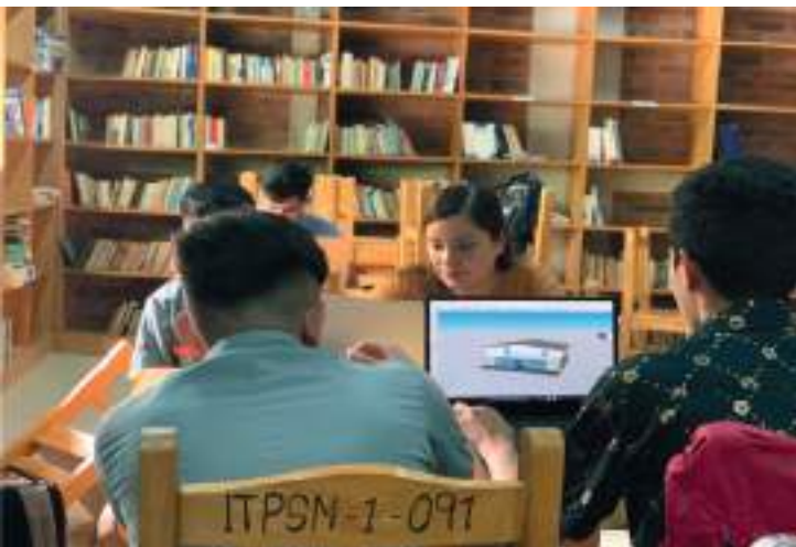
Estudiantes realizando trabajo en grupo.

Las evaluaciones son ponderadas en una escala de cero (0.0) a diez (10.0). La nota final mínima para aprobar una asignatura es de seis (6.0).