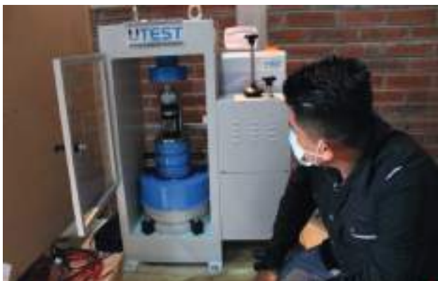
Máquinas de ensayos en Materiales de Construcción.

Laboratorio de Ingeniería de Construcción: Equipado con herramientas para prácticas de Análisis de suelos, Ensayos en Materiales de construcción y Geotécnicas, entre otros.