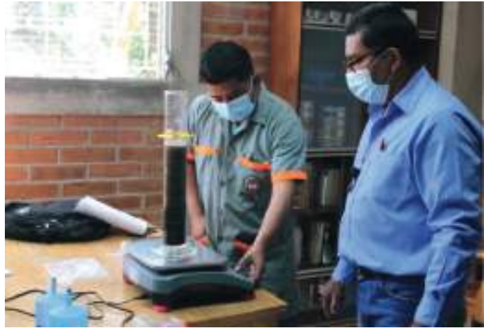
Máquinas de ensayos en Materiales de Construcción.

Adicionalmente, en las áreas de construcción, fontanería y energía, los alumnos complementan su formación al asistir a los laboratorios de la UCA. Personal académico de la UCA colabora impartiendo los laboratorios.