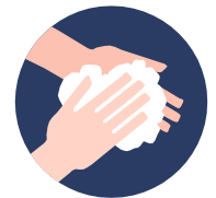
Ilustración Lavado de manos

Después de la toma de temperatura, el colaborador, estudiante o tercero realiza protocolo de higienización de manos. Se dispone de lavamanos con pedal y jabón para el lavado de manos y brazos en caso de portar camisa manga corta. Posterior al lavado de manos, se le aplica alcohol gel o solución hidroalcohólica al 70% en sus manos. En el caso de los visitantes en vehículo este paso se hace luego del desabordaje en el parqueo.