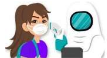
Ilustración toma de Temperatura

Al detectarse un caso sospechoso de COVID-19 dentro de las instalaciones durante la jornada, este será trasladado inmediatamente al área destinada para tal efecto, mientras espera ser atendido por el sistema de salud vía telefónica (132) con asistencia del encargado de salud. Posteriormente será enviado a su residencia, o a la unidad de salud, según indicaciones del personal de salud.