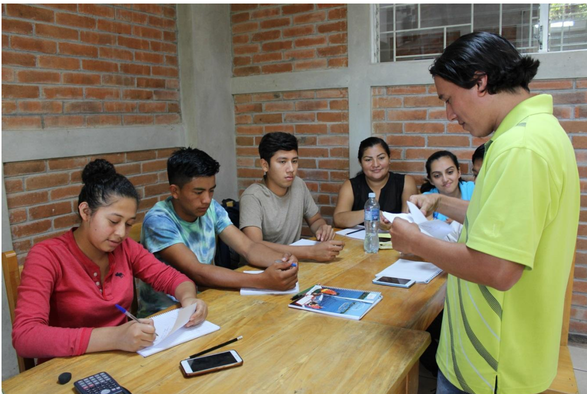
Estudiantes realizando trabajo de grupo