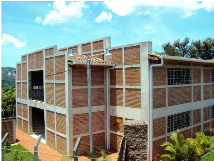
Edificio de aulas del Instituto Tecnológico Padre Segundo Montes