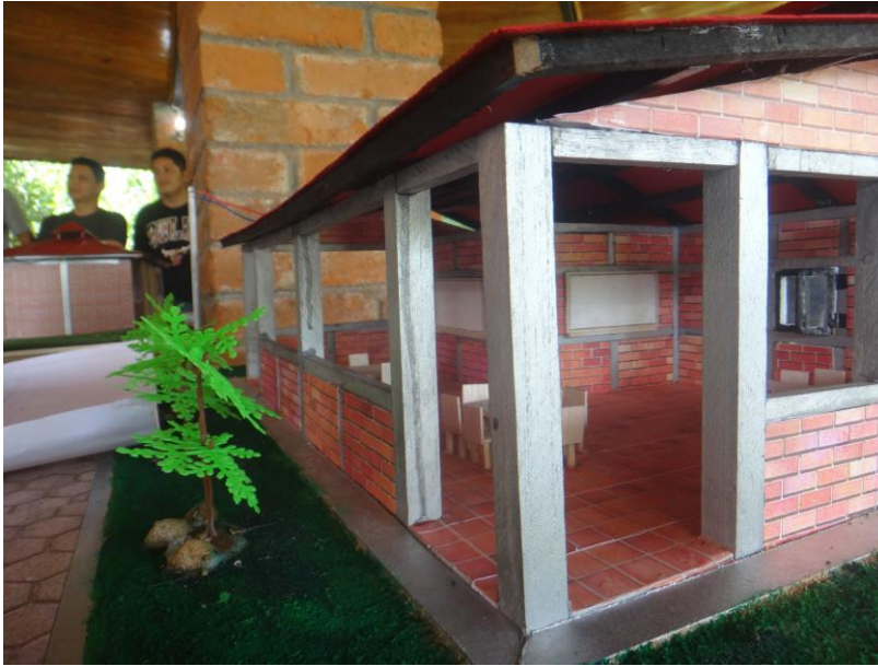
Estudiantes trabajando en modelos a escala de proyectos de construcción