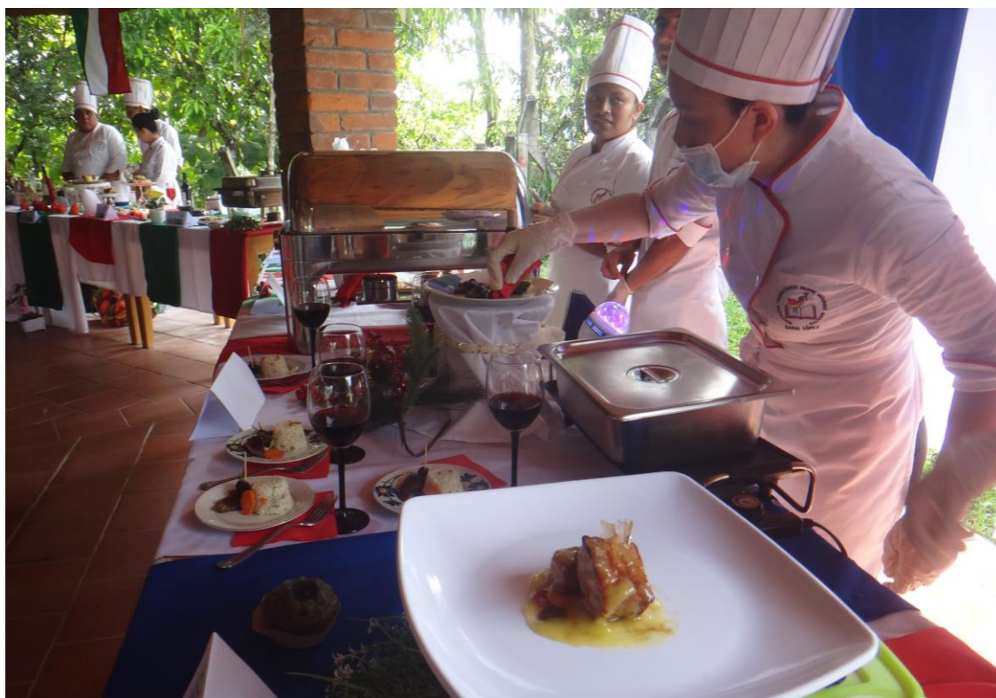
Estudiantes en prácticas de Hostelería y Turismo

El Instituto promueve las prácticas profesionales con un alto nivel tanto en sus propias instalaciones como en empresas o instituciones públicas y privadas. Esto constituye un sello distintivo de la institución.