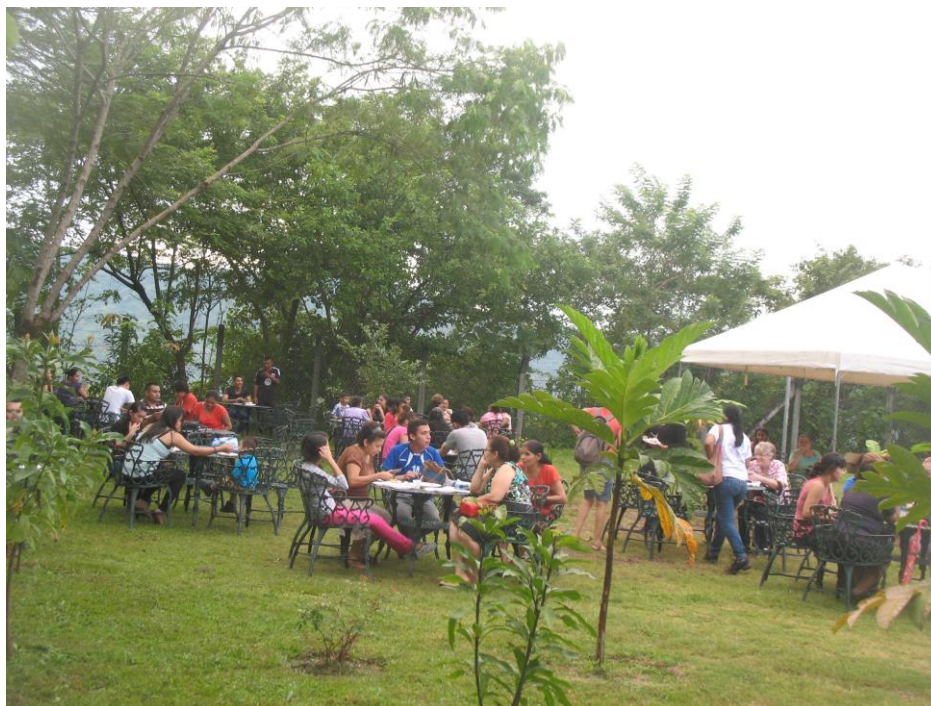
Agradables áreas verdes

Además se cuenta con el Centro de Recursos para el Aprendizaje (CRA), la Biblioteca, espacios para practicar dos deportes: volleyball y tenis de mesa y agradables zonas verdes. Para el 2019 se han hecho gestiones con la Alcaldía Municipal de Meanguera para el uso de las instalaciones deportivas de la Comunidad San Luis en día viernes en horario de 2:30 pm a 4:30 pm.