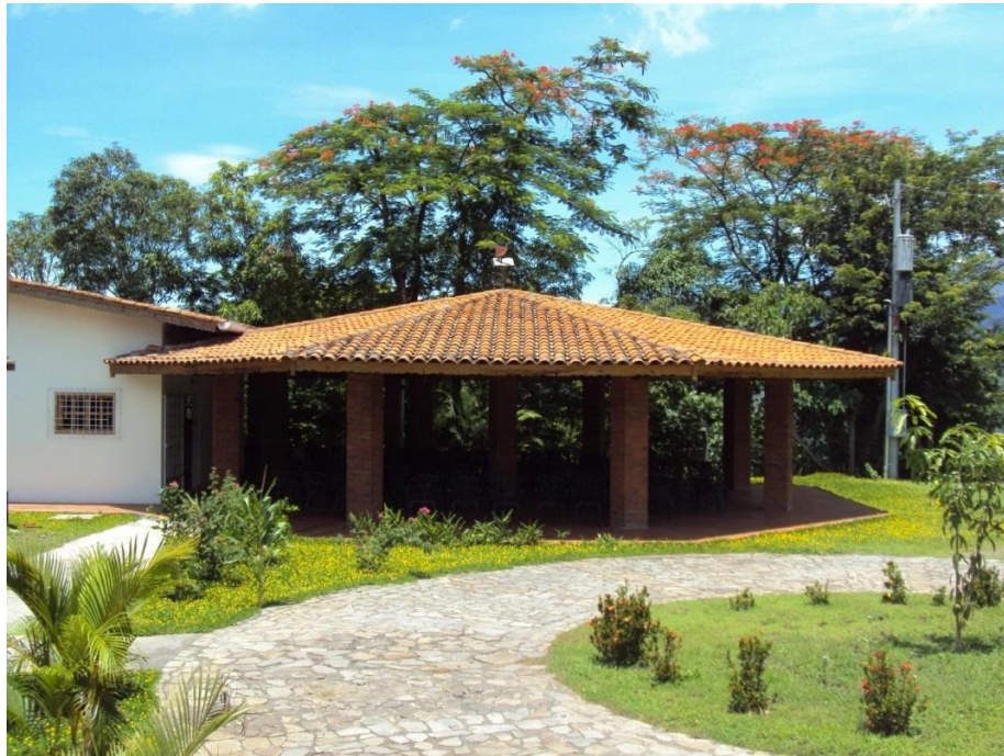
Instalaciones del Restaurante Escuela ITPSM

En el campus se encuentra el Restaurante-Escuela que dispone de cocina y comedor totalmente equipados para desarrollar las clases y actividades de la carrera Técnico en Hostelería y Turismo.