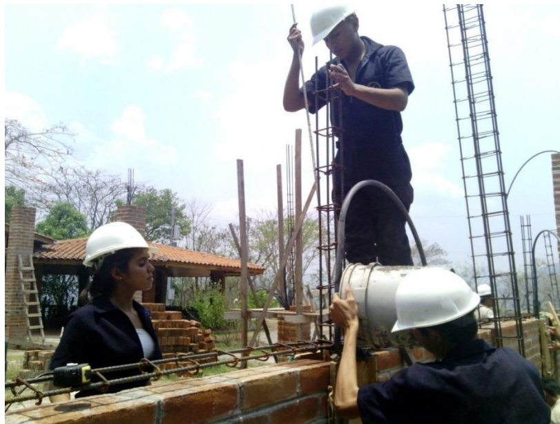
Estudiantes en prácticas de técnicas de construcción