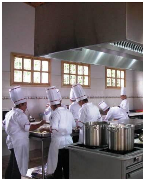
Restaurante Escuela del ITPSM

Laboratorio de cocina: equipado de cocina industrial y área de preparación de alimentos, mesa fría y caliente, área de lavado, y extractor, almacén y área de atención al cliente. El Restaurante Escuela del ITPSM es un recurso valioso para el proceso de enseñanza aprendizaje de Hostelería y Turismo.