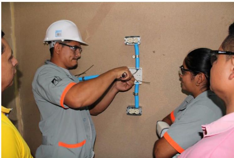
Estudiantes en prácticas de Instalaciones Eléctricas Residenciales

Laboratorio de electricidad: equipado con herramientas para la práctica de instalaciones eléctricas residenciales e industriales.