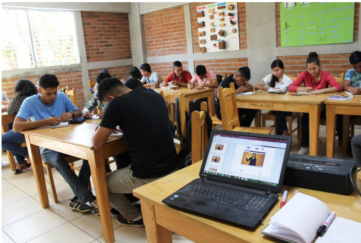
Estudiantes del ITPSM realizando trabajo académico

Cada año académico está constituido por dos ciclos ordinarios de veinte semanas cada uno. Las fechas de inicio y fin de los ciclos, así como las principales fechas de las actividades académicas se publican en el calendario académico del Instituto.