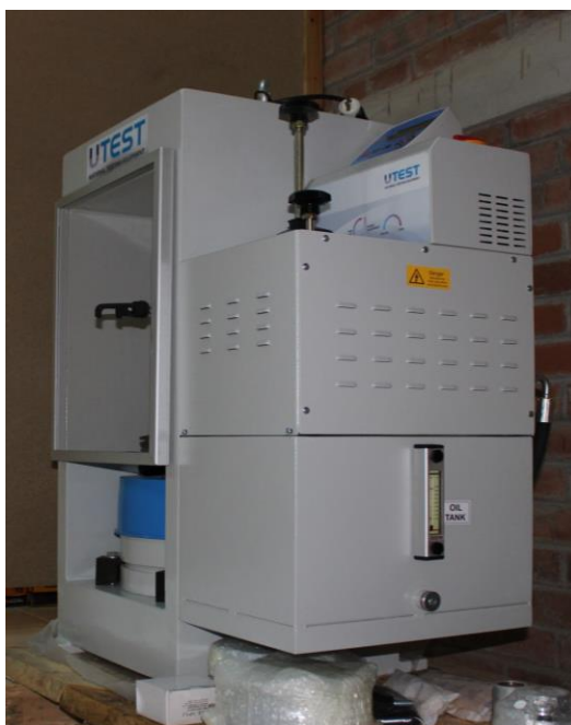
Máquina de ensayos en Materiales de Construcción

Laboratorio de Ingeniería de Construcción: Equipado con herramientas para prácticas de Análisis de suelos, Ensayos en Materiales de construcción y Geotécnicas, entre otros.