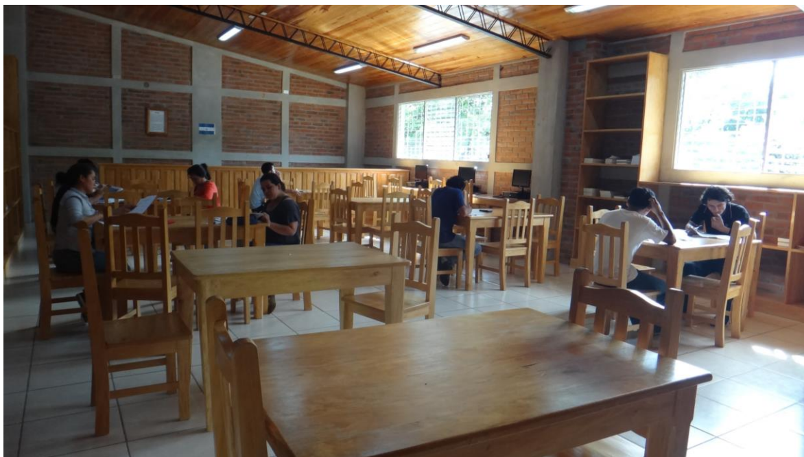
Biblioteca del Instituto Tecnológico Padre Segundo Montes